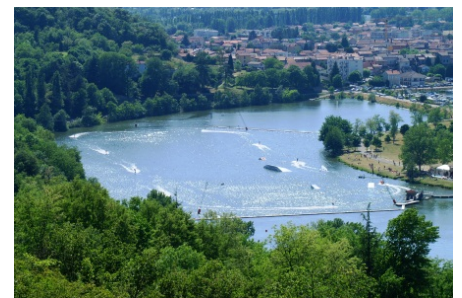
TELESKI NAUTIQUE WAKEBOARD