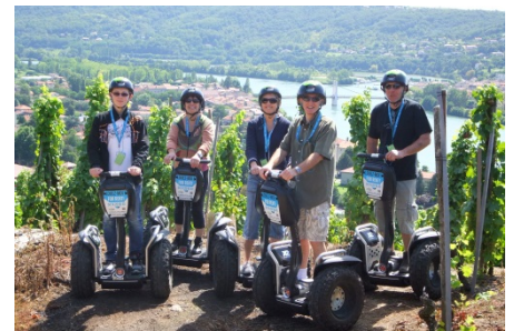
BALADES NATURE EN GYROPODE SEGWAY

Le PRL dispose de 8 chalets 5-7 pers. et d'un chalet PMR 4-6 pers. Sur un domaine clos avec parking privé, aire de jeux, services à proximité. Plage publique avec baignade surveillée en juillet et août